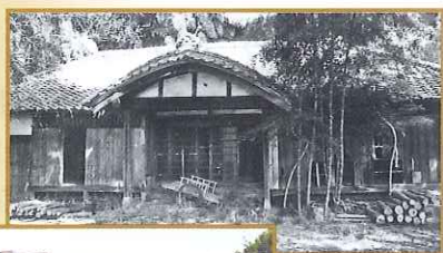
文武両道を錬磨した私塾 日新塾